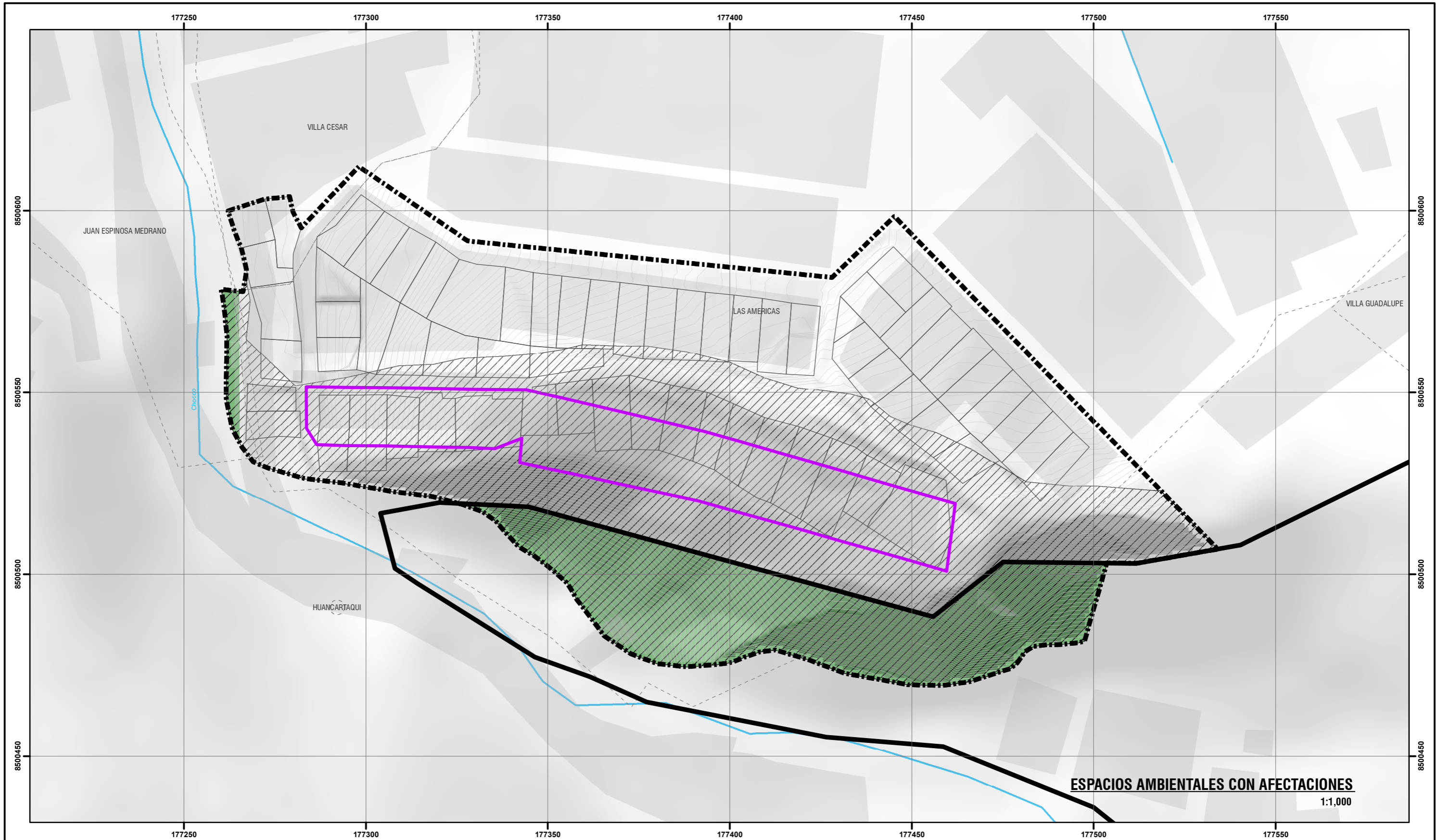
ESPACIOS AMBIENTALES CON AFECTACIONES 1:1,000